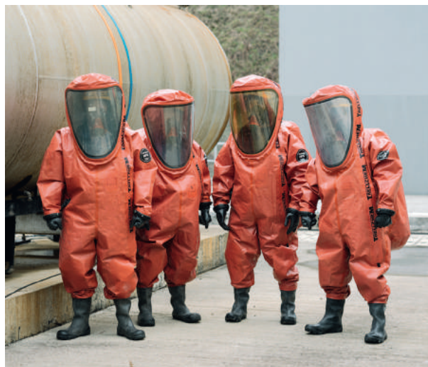
Главное — безопасность страница 11