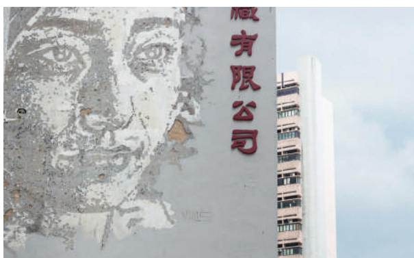
Сохранение наследия страница 05