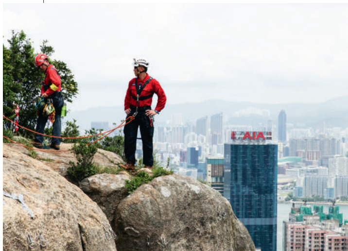
Лидеры отрасли страница 10

Расположение: Мост в Азию и за ее пределы Кого Вы встретите: Дизайнеров, которые меняют облик кофеен, отелей и рабочих пространств Правовая система: Благодаря прочной правовой системе и низким показателям преступности Вы будете чувствовать себя в безопасности, создавая бизнес или решая завести семью Что посетить: Наш однодневный маршрут Образ жизни: В центре внимания – креативные компании Маркетинг: Сила цветов поможет Вам стать заметными