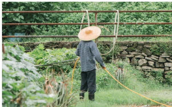
Работа на объектах страница 13